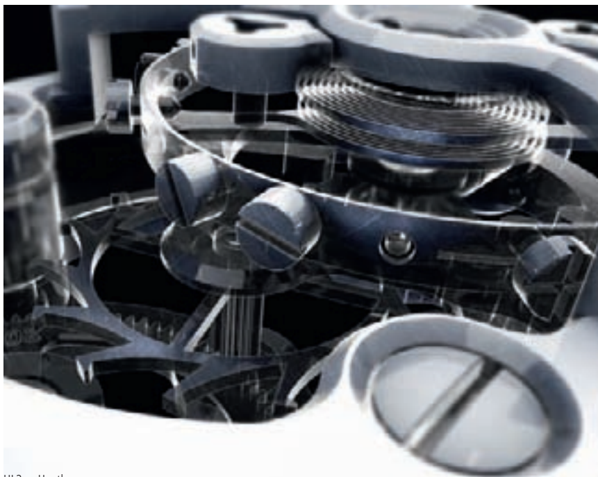
HL2 от Hautlence