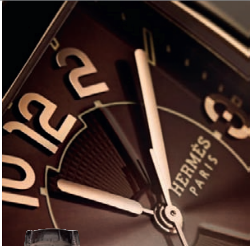
CAPE COD GRANDES HEURES от Hermès

продукции марки лишь незначительно снизились, на 9%, что позволило выстоять во время экономической бури и избежать увольнений (в компании в Биле работает 100 сотрудников, еще 50 – в отделениях). По словам Люка Пэррамона, начало 2010 года ознаменовалось значительными темпами роста, достигшими двузначных цифр. Чтобы продемонстрировать свою решимость войти в сегмент престижной часовой продукции, Hermès намеревается каждый год представлять серию особых моделей, оснащенных механизмами с осложнениями. С этой целью марка планирует сотрудничество с мануфактурой Vaucher (чье положение несколько пошатнулось, судя по сообщениям об увольнении 50 сотрудников), частью которой владеет Hermès. К тому же она планирует обратиться к различным видам часового искусства и ремесел, включая гравировку и эмаль. Представленная в этом году первая модель с турбийоном от Hermès облачена в высшей степени классический корпус Cape Cod. За ней в рамках серии Cape Cod следует модель Lunar Phases. В коллекции Dressage появились модели Arceau Pocket, Perpetual Calendar и Annual Calendar, а Cape Cod Grandes Heures обрела часовую стрелку,