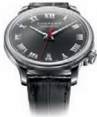
L.U.C. 1937 от Chopard

секундную стрелку, а также запас хода в 7 дней. Кроме того, модель получила вечный календарь, 24-часовой индикатор, указатель дня недели, указатель даты в окошке, указатель месяца, високосного года, индикатор запаса хода, функцию уравнивания времени, индикатор времени восхода/захода солнца, а также точный индикатор фаз Луны. Ультрасложнение "все в одном", представленное также в коллекциях других марок, было на BaselWorld далеко не редкостью.