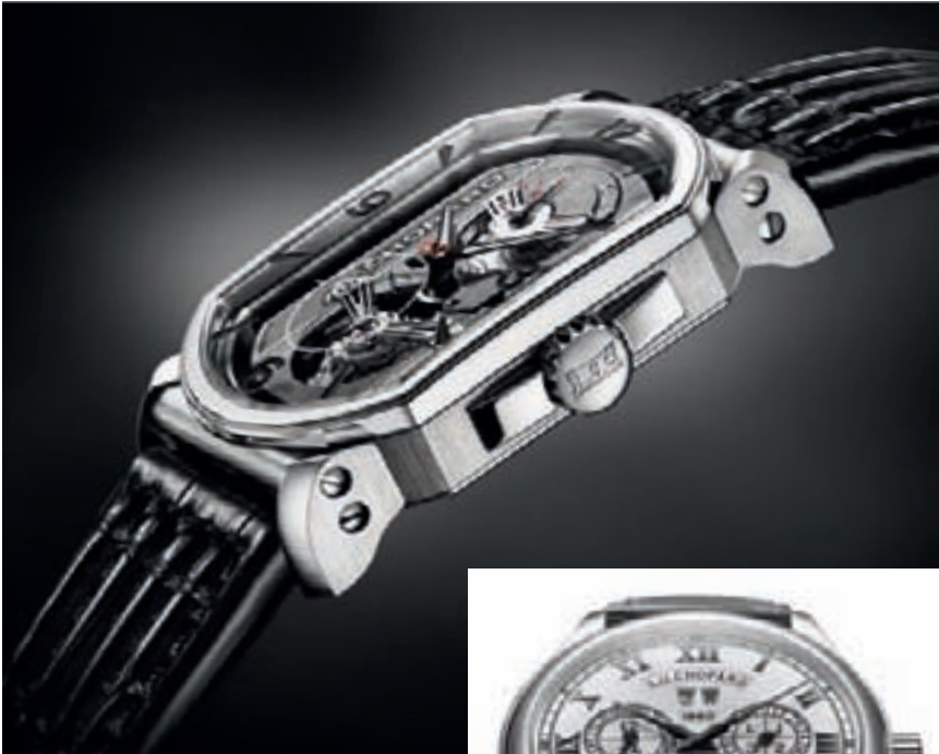
L.U.C. ENGINE ONE TOURBILLON от Chopard

ренность, характеризующая автоматическую модель L.U.C. 1937 в круглом корпусе, оснащенную первым калибром Manufacture Fleurier (на основе механизма L.U.C. 1.010, предназначенного для производства в промышленном масштабе). Во-вторых, стилистический разрыв с прошлым, продемонстрированный в ультратонкой модели L.U.C. Engine One Tourbillon, чей механизм, оснащенный турбийоном с кареткой из алюминия, "производится как блок двигателя" и размещается на "сайлентблоках" внутри титанового корпуса. Противоположная сторона, на которую направлена стрелка часового компаса, посвящена истории, которая в случае Chopard приобретает абсолютно необычную форму в виде модели L.U.C. Louis-Ulysse The Tribute. Модель эта с крупным корпусом диаметром 49,6 мм напоминает одновременно и наручные, и карманные часы благодаря хитроумной системе, на создание которой часовщики марки вдохновило изобретение Карла Шойфеле I 1912 года, позволяющее крепить карманные часы к кожаному ремешку. Механический калибр ручного подзавода, созданный специально по этому случаю, украшает особая надпись, L.U.C.