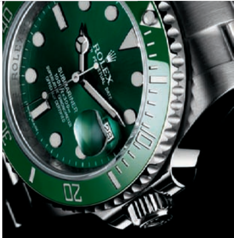
SUBMARINER DATE от Rolex

Rolex, похоже, твердо решила заняться продвижением своей второй марки, Tudor, обеспечивая средства для реализации ее амбиций. За последние несколько месяцев коммуникационная деятельность марки возросла, включая разнообразные инициативы в спортивной сфере и другие публичные события. Обновленная промо-кампания Tudor под руководством молодой команды построена вокруг двух основных линий, Grand Tour и Glamour. Следуя сегодняшней моде на “плоские” формы, прекрасная модель Tudor Heritage Chrono, как видно уже из ее названия, черпает вдохновение из исторического прошлого марки (основанной в 1929 году). Была пересмотрена и модернизирована форма корпуса, браслета, ушек и браслета оригинальной модели 70-х, посвященной автогонкам. Эта весьма привлекательная модель от Tudor, в полной мере использующая “винтажный” стиль, который лишь подчеркивается черно-оранжево-серым тканевым ремешком, предлагается по цене около 3000 евро.