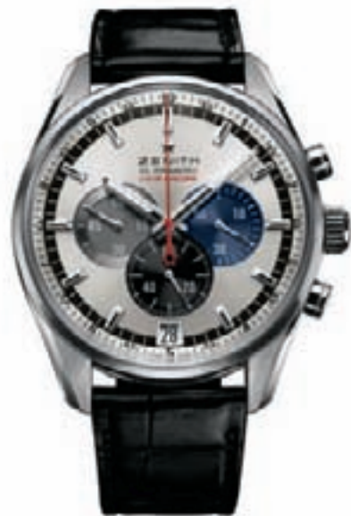
EL PRIMERO STRIKING 10TH of Zenith

вокруг циферблата, совершаемый за 10 секунд.