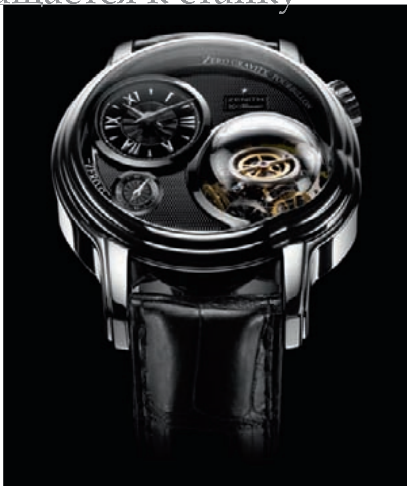
ACADEMY G ZERO

“Мне пришлось начать с осознания ценности нашего прошлого, — говорит Жан-Фредерик Дюфур, — после чего критически оценить наше наследие, включающее в себя не менее двух с половиной тысяч различных часов, и это не считая бесценного богатства в виде ин-