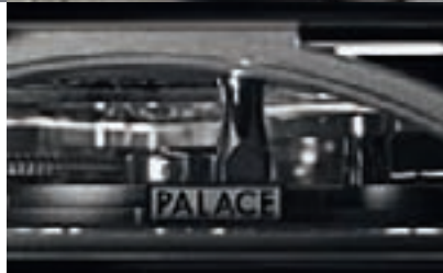
PALACE от Jean Dunand