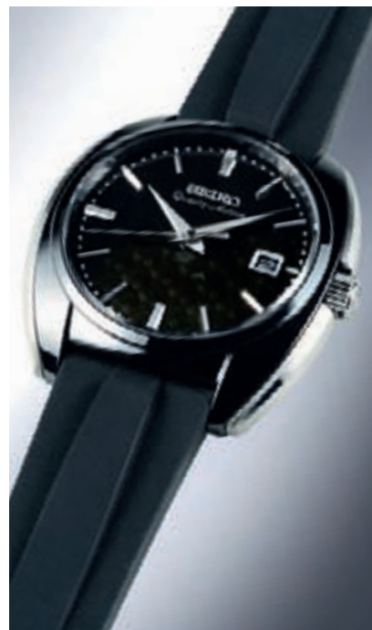
QUARTZ ASTRON THE COMMEMORATIVE EDITION or Seiko

запуска Spring Drive эта крупная японская компания продолжает работать над слиянием различных областей знания. В этом году благодаря технологии Spring Drive в коллекции Ananta появятся две очень красивые, элитарные модели — Ananta SD Moon Phase и Ananta SD Chronograph (стоимостью 4000 и 6300 евро соответственно). В попытке еще более ярко отразить японскую культуру и стиль Ananta марка оснастила новую Ananta SD Moon Phase механизмом, отличающимся утонченной архитектурой и великолепной, невероятно экспрессивной отделкой "лунный луч". Выведа коллекцию Grand Seiko Collection на мировой рынок, марка подтвердила свое стратегическое решение постепенно перейти в более высокий ценовой сегмент, утверждая свое богатейшее наследие (марка была основана в 1881 году) и улучшая свой международный имидж. Коллекция эта представляет собой лучшие из тра-