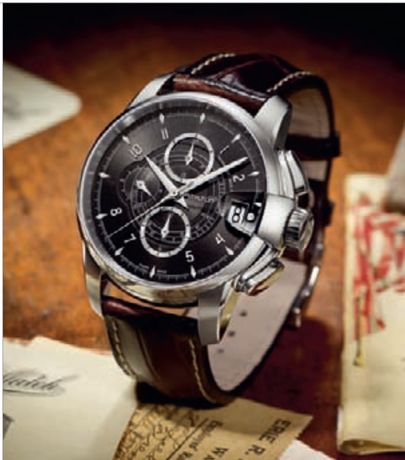
RAILROAD AUTO CHRONO

Более полная информация – в разделе Brand Index на www.europastar.com