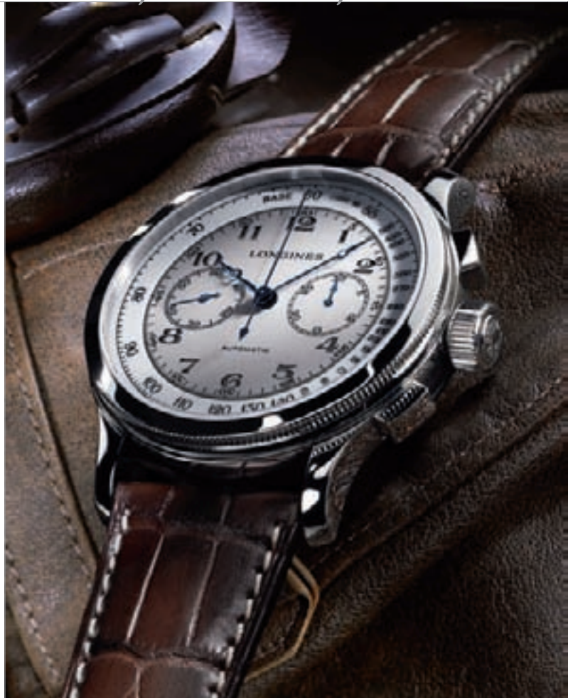
LONGINES LINDBERGH'S ATLANTIC VOYAGE WATCH

Часы эти были оснащены механизмом наручного хронографа с 30-минутным счетчиком. Они измеряли время с точностью до 1/5 секунды, а механизм хронографа был также снабжен тахиметром, который мог измерять скорость до 500 км/ч. В условиях, в которых осуществляла свой перелет чета Линдбергов, надежные часы были одним из важнейших навигационных инструментов.