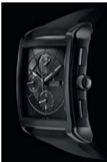
PONTOS FULL BLACK

Мартин Бахман также утверждает, что планирует и дальше двигаться по пути вертикализации производства марки, начатой его предшественником. Мануфактура марки в