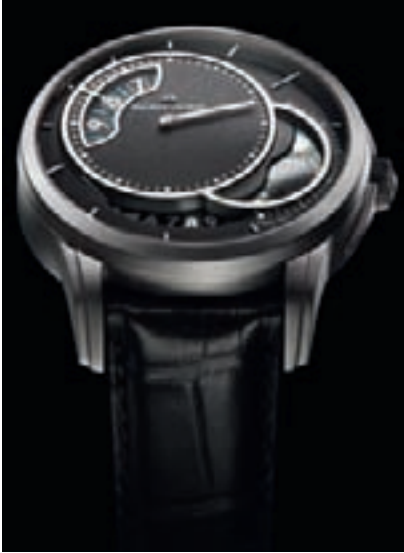
PONTOS DÉCENTRIQUE LUNAR PHASES от Maurice Lacroix

(который составляет 48 часов) у метки “3 часа”. Главную сложность представлял поиск такой формы зубцов, которая обеспечила бы постоянство передачи энергии в зубчатом зацеплении. Решением стало использование технологии LIGA при создании колес. В результате получились просто поразительные часы. Еще больше поражает тот факт, что циферблат, украшенный ободом из черного золота, является к тому же платиной механизма. Сквозь прозрачную заднюю крышку из сапфирового стекла виднеется красивый антрацитовый механизм с линейным сатинированием. Эти часы, несомненно, символизируют собой новое направление развития Maurice Lacroix.