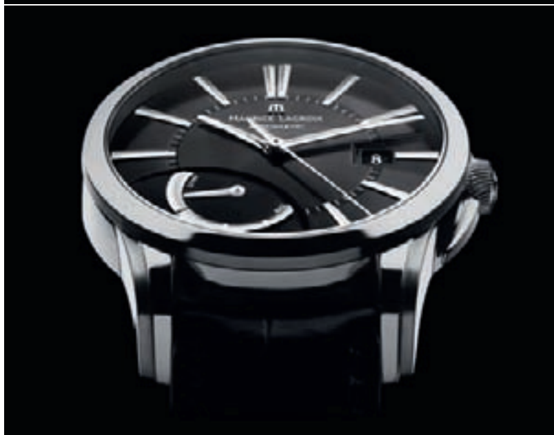
PONTOS DÉCENTRIQUE LUNAR PHASES и PONTOS POWER RESERVE