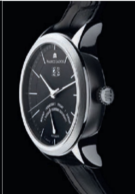
CLASSIC RETROGRADE DAY

Франш-Монтань и фабрика по производству механизмов Quéloz самым тесным образом связаны с группой Maurice Lacroix, оставаясь при этом открытыми для сотрудничества с третьими лицами. “Здесь я поддерживаю Николаса Хайека и считаю, что нашей задачей как производителя часов, претендующего на статус подлинного, является развитие всей необходимой промышленной базы”, – утверждает Бахман.