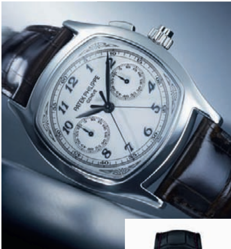
5950A от Patek Philippe

на молочно-белом циферблате — и при этом винтажный вид, который ему придает стилизованный узор из листьев, выгравированный по четырем углам циферблата. Еще одна модель царства хронографов, но уже с великим усложнением и “ретро-современным” обликом, который лишь подчеркивается подушкообразным корпусом, Reference 5951P с единственной кнопкой хронографа, вечным календарем, индикатором фаз Луны и хронографом с функцией flyback является самой плоской моделью в мире. 400 компонентов калибра Calibre CH R 27.525PS Q занимают пространство диаметром 27,3 мм и толщиной 7,3 мм.