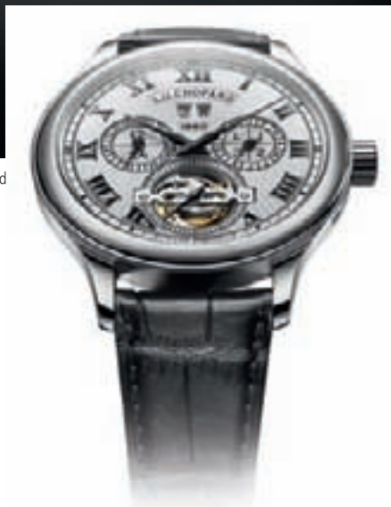
L.U.C. 150 ALL IN ONE от Chopard

ренность, характеризующая автоматическую модель L.U.C. 1937 в круглом корпусе, оснащенную первым калибром Manufacture Fleurier (на основе механизма L.U.C. 1.010, предназначенного для производства в промышленном масштабе). Во-вторых, стилистический разрыв с прошлым, продемонстрированный в ультратонкой модели L.U.C. Engine One Tourbillon, чей механизм, оснащенный турбийоном с кареткой из алюминия, "производится как блок двигателя" и размещается на "сайлентблоках" внутри титанового корпуса. Противоположная сторона, на которую направлена стрелка часового компаса, посвящена истории, которая в случае Chopard приобретает абсолютно необычную форму в виде модели L.U.C. Louis-Ulysse The Tribute. Модель эта с крупным корпусом диаметром 49,6 мм напоминает одновременно и наручные, и карманные часы благодаря хитроумной системе, на создание которой часовщики марки вдохновило изобретение Карла Шойфеле I 1912 года, позволяющее крепить карманные часы к кожаному ремешку. Механический калибр ручного подзавода, созданный специально по этому случаю, украшает особая надпись, L.U.C.