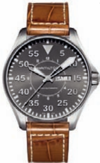
KHAKI KING PILOT

Watch of Railroad Accuracy, Lancaster 1892" ("Часы железнодорожной точности, Ланкастер 1892"). В рамках коллекции выпущены: Valgrange Small Second, Valgrange Chrono и 38mm с автоматическим калибром.