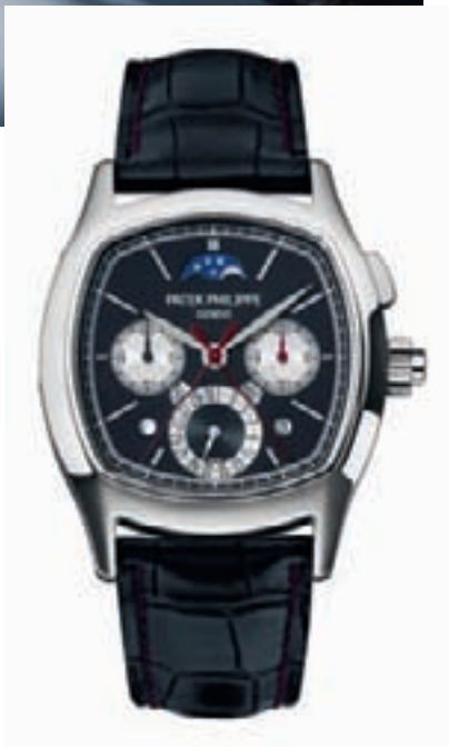
5951P от Patek Philippe

Есть нечто такое, что отличает семейные марки от других. Возможно, это тот факт, что им просто некуда спешить. Мы пришли именно к такому выводу, направляясь от стенда Patek Philippe к стенду Hermès. “Се-