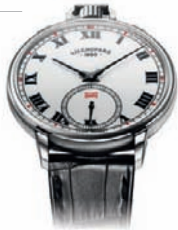
L.U.C. LOUIS-ULYSSE THE TRIBUTE от Chopard

ENG, поскольку этот, прошедший сертификацию COSC, калибр с Poinçon de Genève ("Женевским клеймом") был создан Chopard в сотрудничестве с женевской часовой школой Ecole d'Horlogerie (EHG). В следующее десятилетие учащиеся школы EHG смогут создать, используя компоненты L.U.C. ENG, традиционные "школьные часы", которые станут венцом их обучения. И наконец, последнее, не менее значимое направление — одинокая звезда, модель haute horlogerie, объединившая в себе целый ряд усложнений, модель L.U.C. All In One. Эти прекрасные часы ручного подзавода, приводимые в действие механизмом L.U.C. 4TQE с турбийоном и четырьмя барабанами, имеют часовую, минутную и