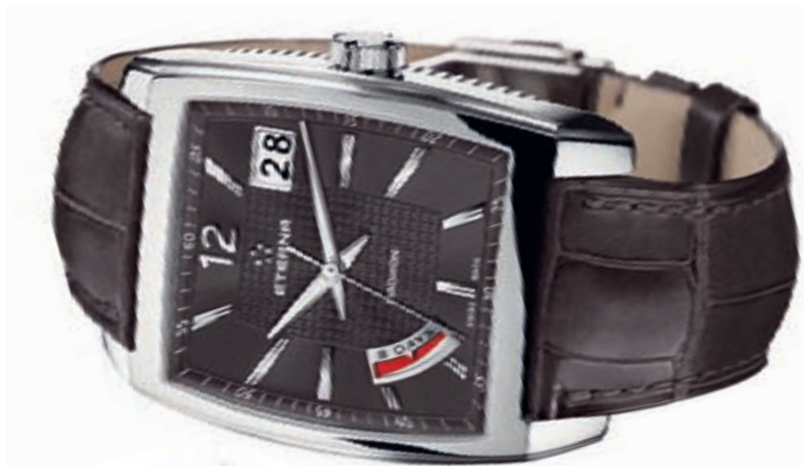
MADISON EIGHT-DAYS or Eterna