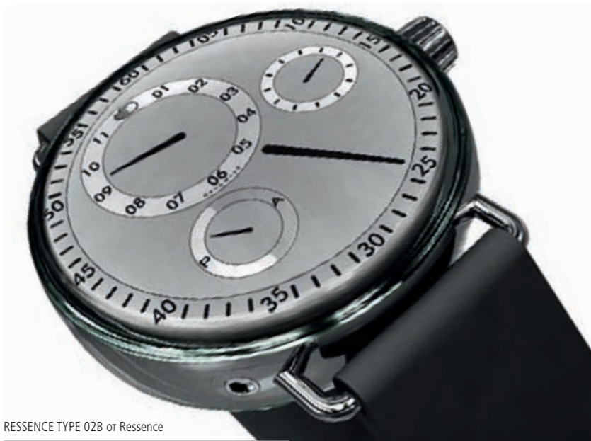
RESSENCE TYPE 02B от Ressençe