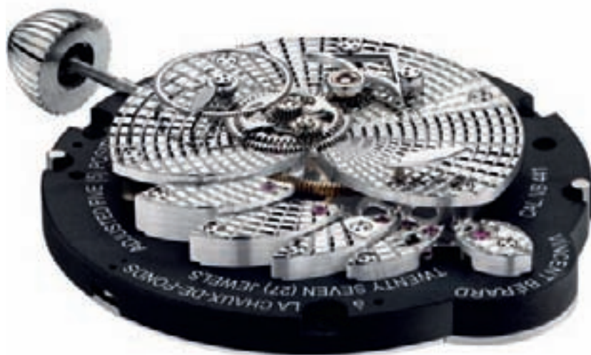
TALISMANE 2 PLATINUM OSTAËLE

Прошлой осенью Венсан Берар открыл новую мануфактуру, мастерские которой разместились в сельском домике неподалеку от Ла-Шо-де-Фон, бывшей ферме, в свое время принадлежавшей часовщику-фермеру. Эти новые мастерские, предназначенные в основном для подготовки, сборки и тщательной ручной отделки компонентов часов, позволяют Венсану Берару и двадцати его коллегам выпускать около ста часов в год. И пусть производство это все еще остается на скорейшем частном уровне, оно все же свидетельствует о подлинном, имеющем важное значение коммерческом развитии марки под руководством Герберта Гаучи. Его усилия нашли поддержку у группы Timex (TGBV), которая, похоже, твердо намерена обеспечить стабильное развитие марки, превратив ее в образец исключительного часового мастерства. Производство ста часов такого высокого качества и оригинальности уже само по себе является настоящим подвигом. Часовое мастерство Венсана Берара, в равной мере художника и часовщика, ставит немалые требования. Он действует как скульптор, стре-