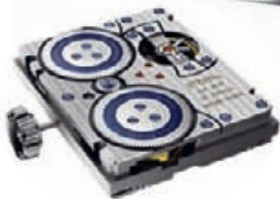
CALIBRE 3510 or Eterna

матического механизма (с парящим барабаном на шарикоподшипниках), позволяющего интегрировать различные функции, например, указатель даты в форме диска или стрелки, или даже 24-часовую стрелку. Уже сегодня третьи стороны могут приобрести этот замечательный механизм с различными стандартизированными элементами, предназначенный для производства в промышленных масштабах. Используя этот механизм в качестве основы, Eterna разработала модуль хронографа, который обладает одной особенностью — он располагается не на стороне циферблата, а на мосту, благодаря чему функции хронографа перемещаются на обратную сторону часов.