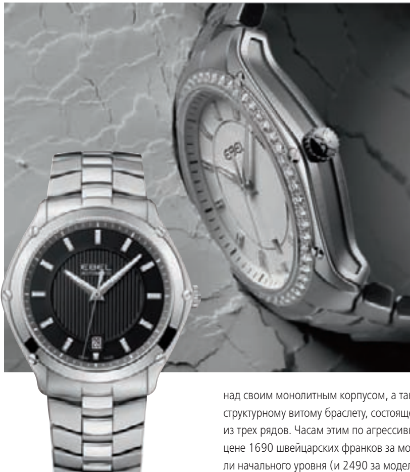
CLASSIC SPORT от Ebel

хитекторы времени”), при этом значительно ее усилил. Мы воспользовались идеей следа, который время оставляет абсолютно на всем, и создали для нашей кампании часы из глины, песка, мела, шелка, воды и прочего”, — говорит Марк Мишель-Амадри. Судя по всему, фокус кампании сместился с “посланных” марки на центральный элемент, собственно продукт. К тому же кампания запланирована на годы (от 5 до 10-ти).