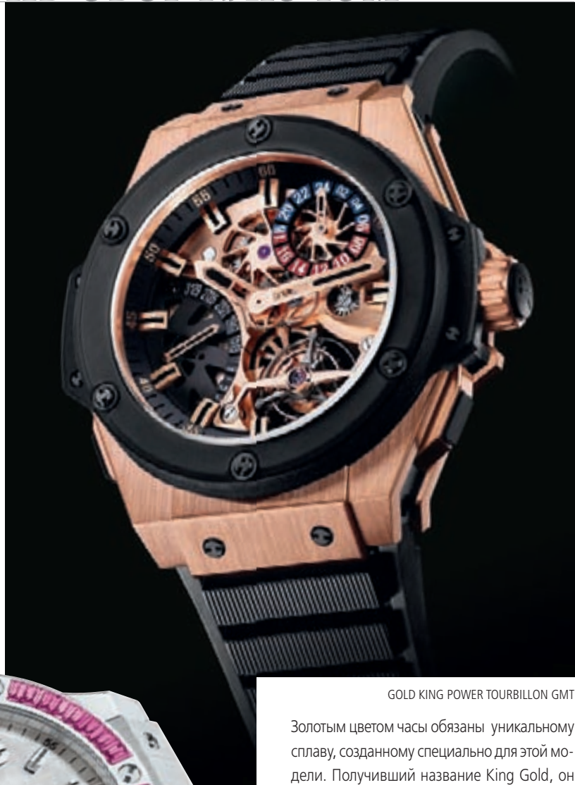
GOLD KING POWER TOURBILLON GMT

King Power Tourbillon GMT стали первыми часами Hublot с турбийоном и индикатором второго часового пояса в виде двуцветного циферблата, расположившегося у метки “2 часа” и позволяющего путешественнику узнать время в любой точке мира. Вторая новинка, представленная в модели – ретроградный указатель даты у метки “9 часов”.