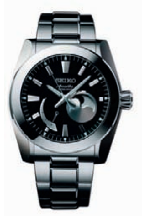
ANANTA SPRING DRIVE MOONPHASE of Seiko

Что касается инноваций, Seiko не останавливается на электронных чернилах. Марка занимается активной разработкой солнечных часов, ставя перед собой цель полного отказа от батареек. А значит, со временем солнечные часы придут на смену кварцевым. Несомненно, богатство предложения — от престижных механических часов до моделей, в которых используется технология электронных чернил — является одной из сильных сторон Seiko. Однако в этом заключается и слабость марки, точнее, один из ее маркетинговых недостатков. В отличие от Swatch Group, различные марки которой лишь дополняют друг друга, Seiko собрала практически все свое разнообразное предложение под одной вывеской (за исключением таких вторичных марок, как Lorus, Pulsar или Alba). Сегодняшние усилия Seiko, направленные на развитие и улучшение своего имиджа и делающие ставку на японских корнях компании, ее историческом наследии и безграничном мастерстве, должны донести до общественности информацию о богатейшей палитре предложения марки.