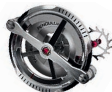
TAG HEUER PENDULUM CONCEPT

Продолжая тему инноваций, TAG Heuer вновь произвела сенсацию, сделав громкое заявление о создании первого механического калибра без балансовой пружины, TAG Heuer Pendulum Concept. Сегодня Concept остается лишь концептом, поскольку при окончательной разработке марка столкнулась с препятствием, и достаточно серьезным, о котором мы поговорим позже. Принцип этих часов, однако, поражает воображение и наверняка откроет новые оригинальные направления в часовом искусстве. Разрушая своей моделью V4