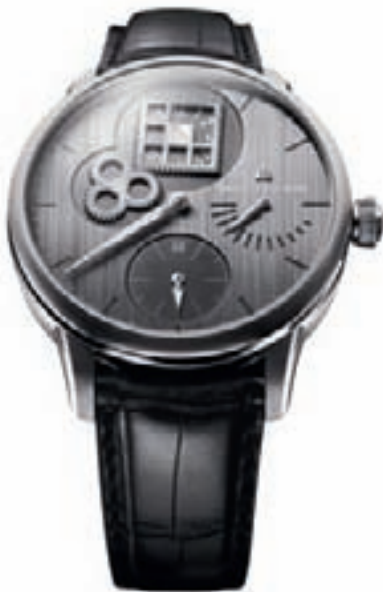
MASTERPIECE RÉGULATEUR ROUE CARRÉE от Maurice Lacroix

мость в смазке. Это нововведение, отвечающее за высокую стабильность, обеспечивает идеальное сцепление колесной передачи. К тому же, поскольку барабан привинчен только с одной стороны, его мост можно с легкостью снимать и вновь собирать, что облегчает сервисное обслуживание.