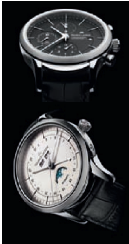
CLASSIC AUTOMATIC CHRONOGRAPH, CLASSIC LUNAR PHASE