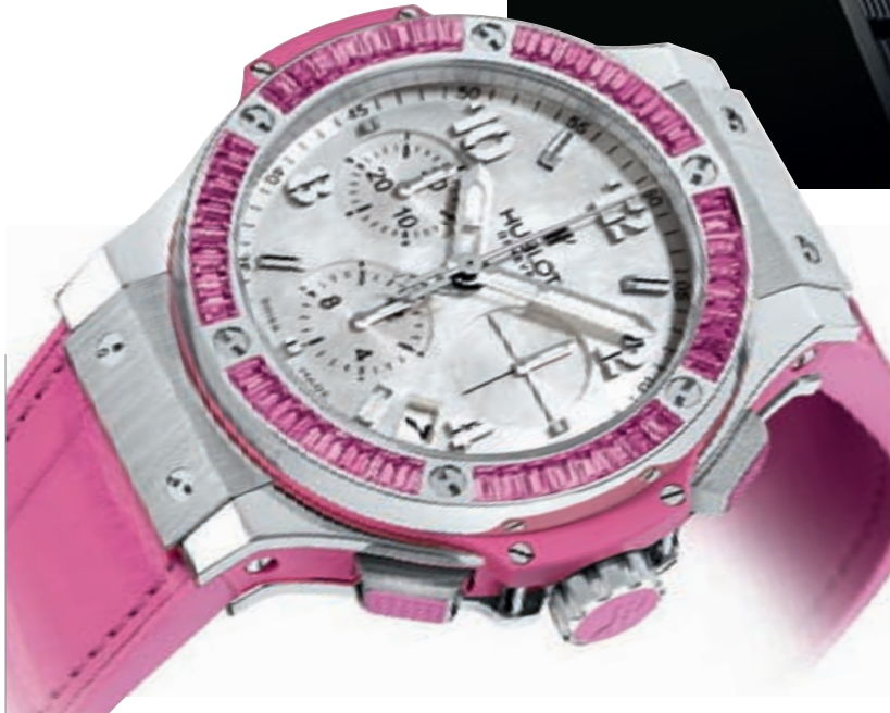
BIG BANG TUTTI FRUTTI ROSE

Более полная информация – в разделе Brand Index на www.europastar.com