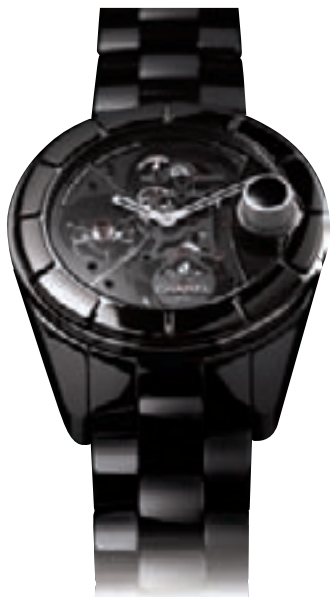
47-MM J12 RÉTROGRADE MYSTÉRIEUSE от Chanel