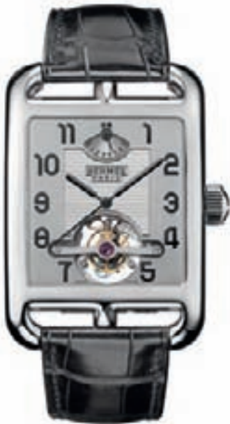
CAPE COD TOURBILLON от Hermès

продукции марки лишь незначительно снизились, на 9%, что позволило выстоять во время экономической бури и избежать увольнений (в компании в Биле работает 100 сотрудников, еще 50 – в отделениях). По словам Люка Пэррамона, начало 2010 года ознаменовалось значительными темпами роста, достигшими двузначных цифр. Чтобы продемонстрировать свою решимость войти в сегмент престижной часовой продукции, Hermès намеревается каждый год представлять серию особых моделей, оснащенных механизмами с осложнениями. С этой целью марка планирует сотрудничество с мануфактурой Vaucher (чье положение несколько пошатнулось, судя по сообщениям об увольнении 50 сотрудников), частью которой владеет Hermès. К тому же она планирует обратиться к различным видам часового искусства и ремесел, включая гравировку и эмаль. Представленная в этом году первая модель с турбийоном от Hermès облачена в высшей степени классический корпус Cape Cod. За ней в рамках серии Cape Cod следует модель Lunar Phases. В коллекции Dressage появились модели Arceau Pocket, Perpetual Calendar и Annual Calendar, а Cape Cod Grandes Heures обрела часовую стрелку,