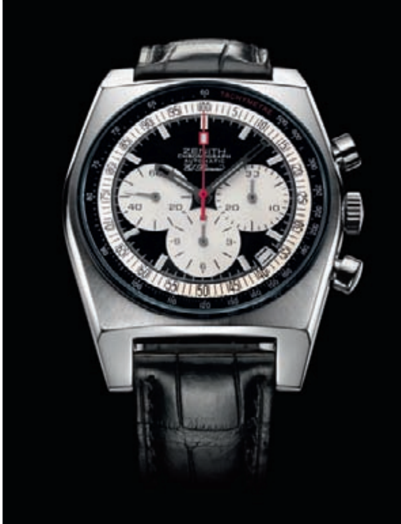
NEW VINTAGE 1969

Более полная информация — в разделе Brand Index на www.europastar.com